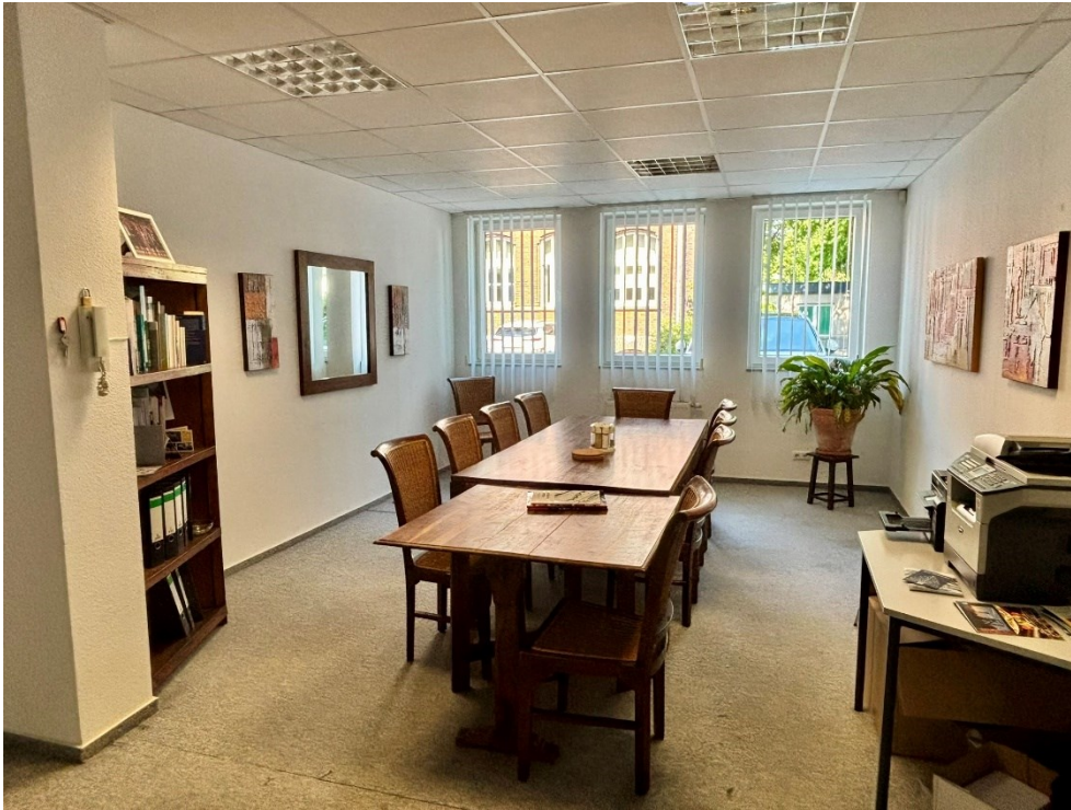
Gemeinschaftsraum mit großem Esstisch