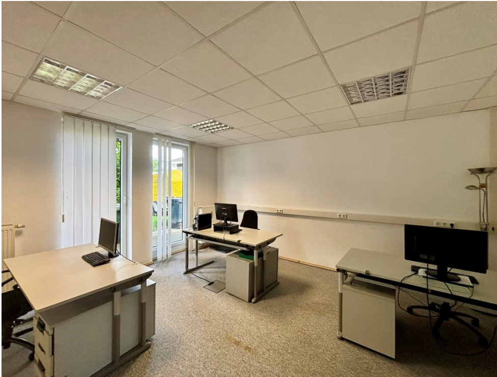
Bürofläche 2 (24m)