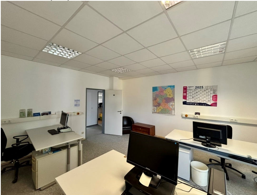
Bürofläche 2 (24m)