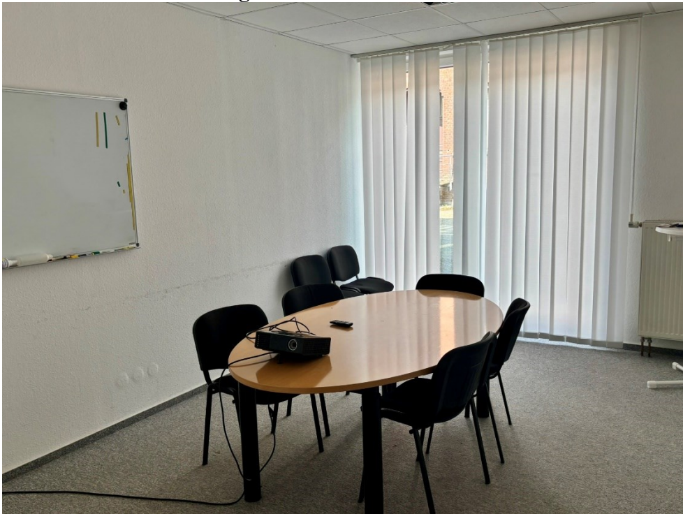
Konferenzraum mit Beamer